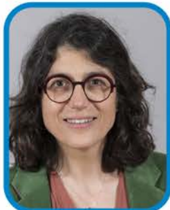
Séverine Chastaing 6 e Adjointe au Maire à la transition écologique