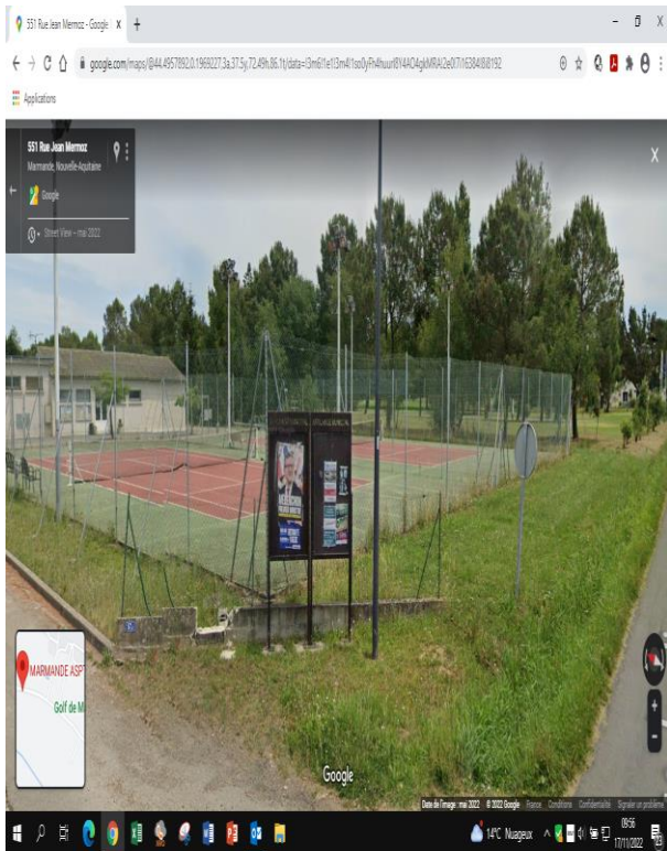
rue Mermoz – ASPTT

Les élus rappellent l'emplacement de deux panneaux d'information municipale : au niveau de l'ASPTT de la rue Mermoz et sur la place Garrigues.